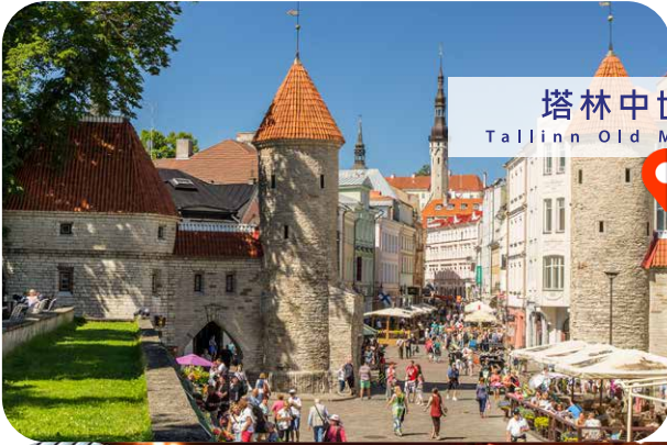
塔林中世纪古镇 Tallinn Old Medieval Town