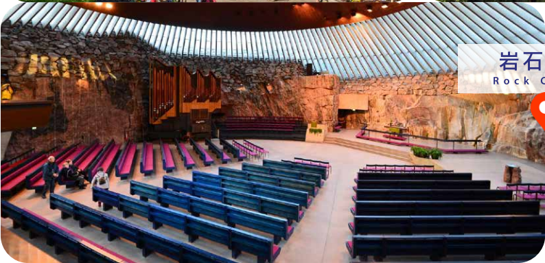
岩石教堂 Rock Church